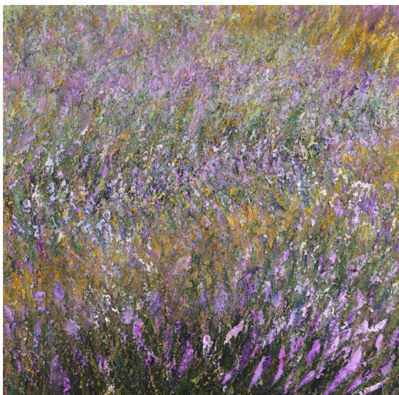
“Campo di lavanda”

La pubblicazione di fotografie ai sensi degli art. 10 e 320 Codice Civile e degli art. 96 e 97 legge 22.4.1941, n. 633 (Legge sul diritto d'autore) potrà avvenire su mezzi di diffusione e social solo con finalità di carattere informativo e culturale e totalmente prive di riferimento a nomi o altri dati sensibili. La presente autorizzazione non consente l'uso delle immagini per usi e/o fini diversi da quelli sopra indicati e potrà essere revocata in qualsiasi momento con comunicazione scritta da inviare via posta o e-mail.